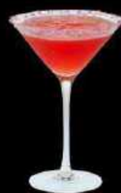
Ruby Spritz 13.90

Vodka française, alcool, jus d'orange, jus d'ananas, parfums fruit de la passion, papaye, pêche, pêche blanche et melon