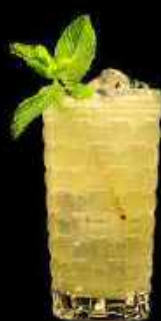
Moscow Mule 13.90

Vodka française, parfums citron, gingembre et concombre