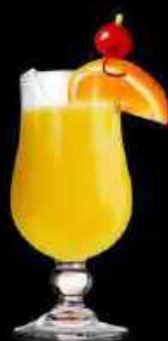
Sex on the beach 13.90

Rhum de Guadeloupe, alcool, jus d'ananas, parfums pastèque, banane, framboise, téquila, gin et citron