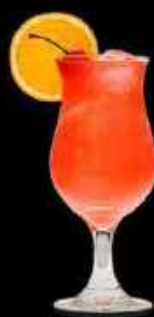
Mai tai 13.90

Crémant ou champagne, alcool, saveurs cerise et fraise des bois