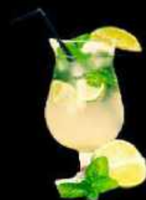
Virgin Mojito 9.90

Fusion pétillante à base de framboise, fraise, citron, violette, myrtille et mûres