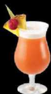
Paradise Dream 9.90