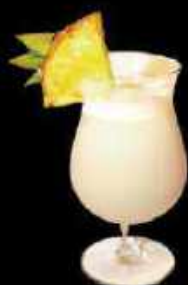
Coconut King 9.90

Mélange subtil au jus d'orange, saveurs litchi, rose et framboise