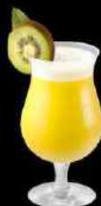
Caribbean Sun 9.90

Tourbillon exotique au jus d'orange, parfum mangue, ananas, kiwi et orange