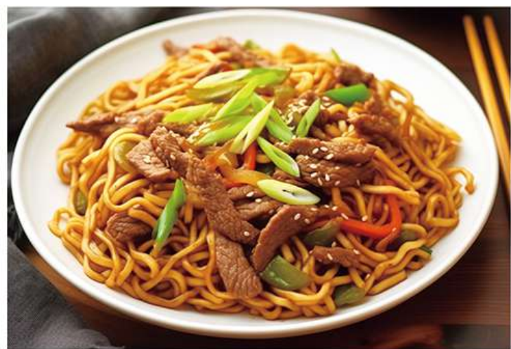
Nouilles Sautées 牛肉炒面 12.5€