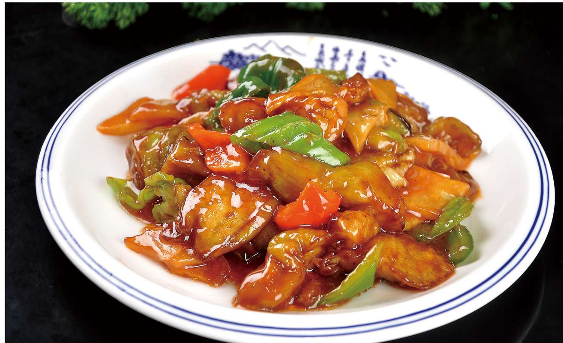
Tois Légumes Sautés du Nord-Est 地三鲜 13€