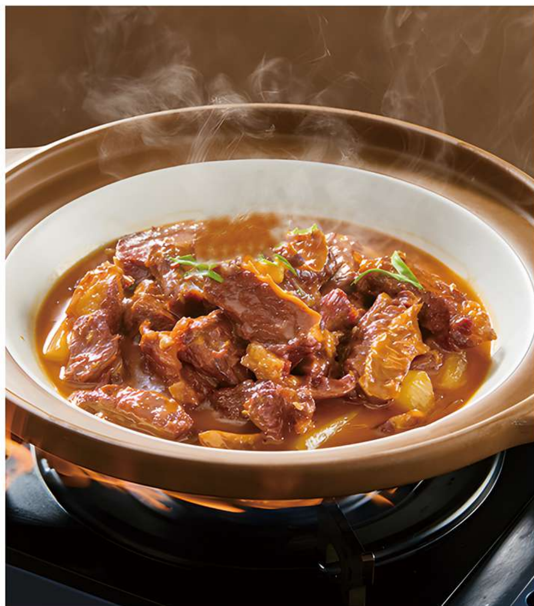
Ragoût de Bœuf en Cocotte 滋味牛腩煲 19€