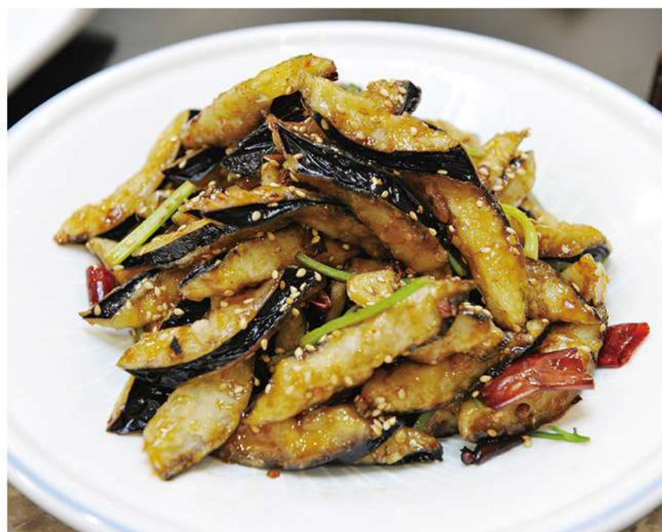
Aubergines Parfumées 风味茄子 13€