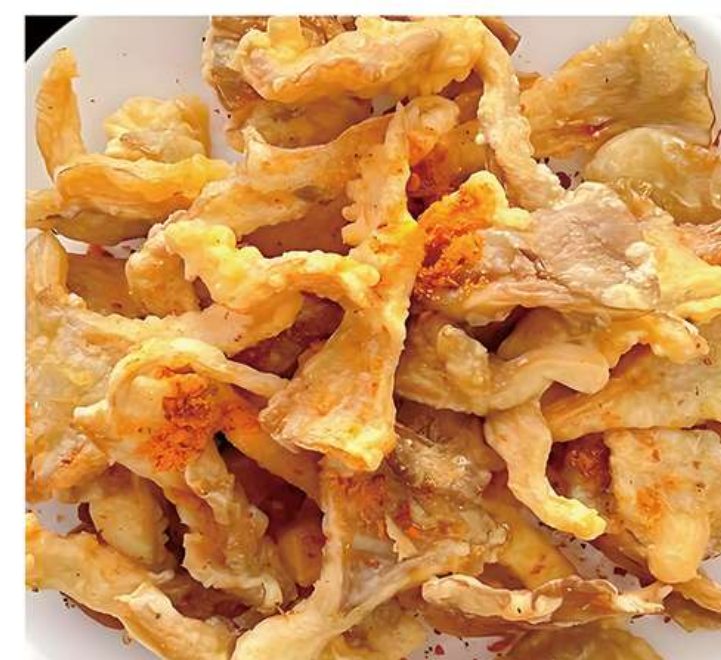
Champignons Frits 炸蘑菇 12€