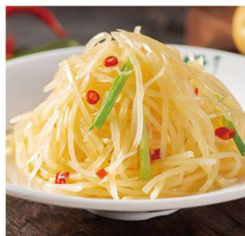
Salade de Pommes de Terre