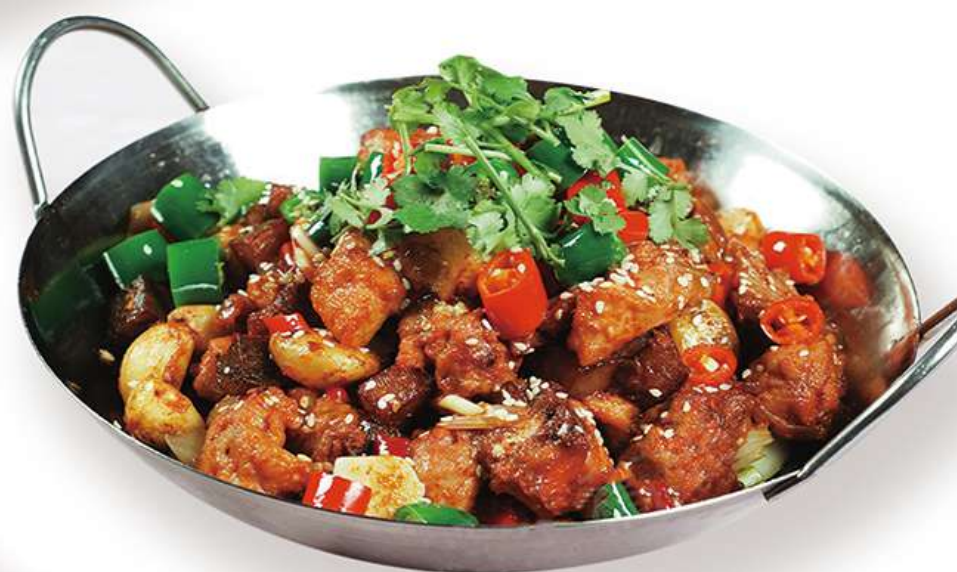
Poulet en Cocotte Pimenté 干锅鸡 18.8€