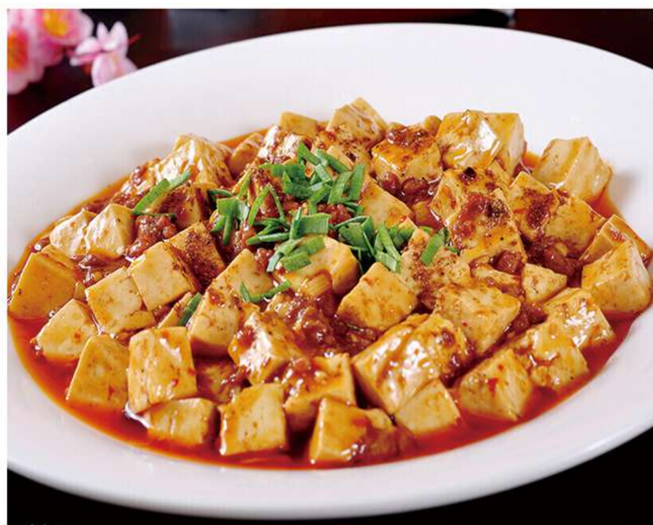
Mapo Tofu 麻婆豆腐 11€

图片仅供参考, 请以实物为准 Les images sont fournies à titre indicatif seulement, veuillez vous référer au produit réel.