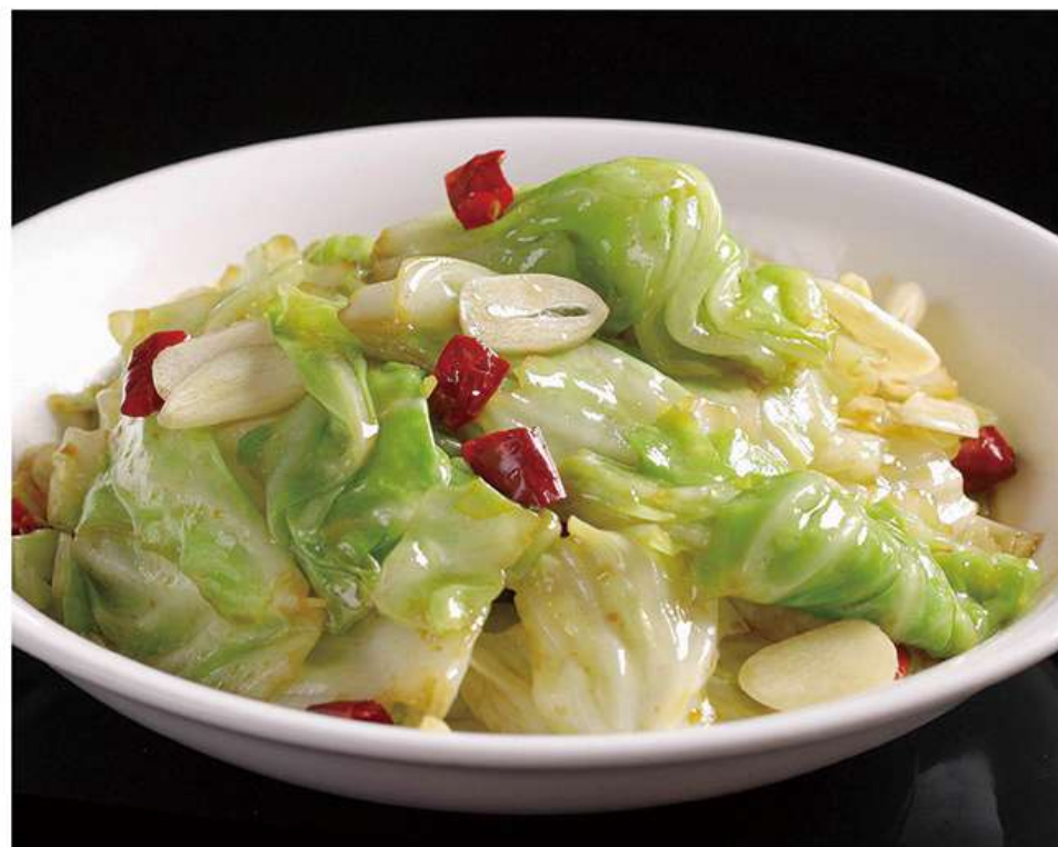
Chous Sauté 手撕包菜 12€