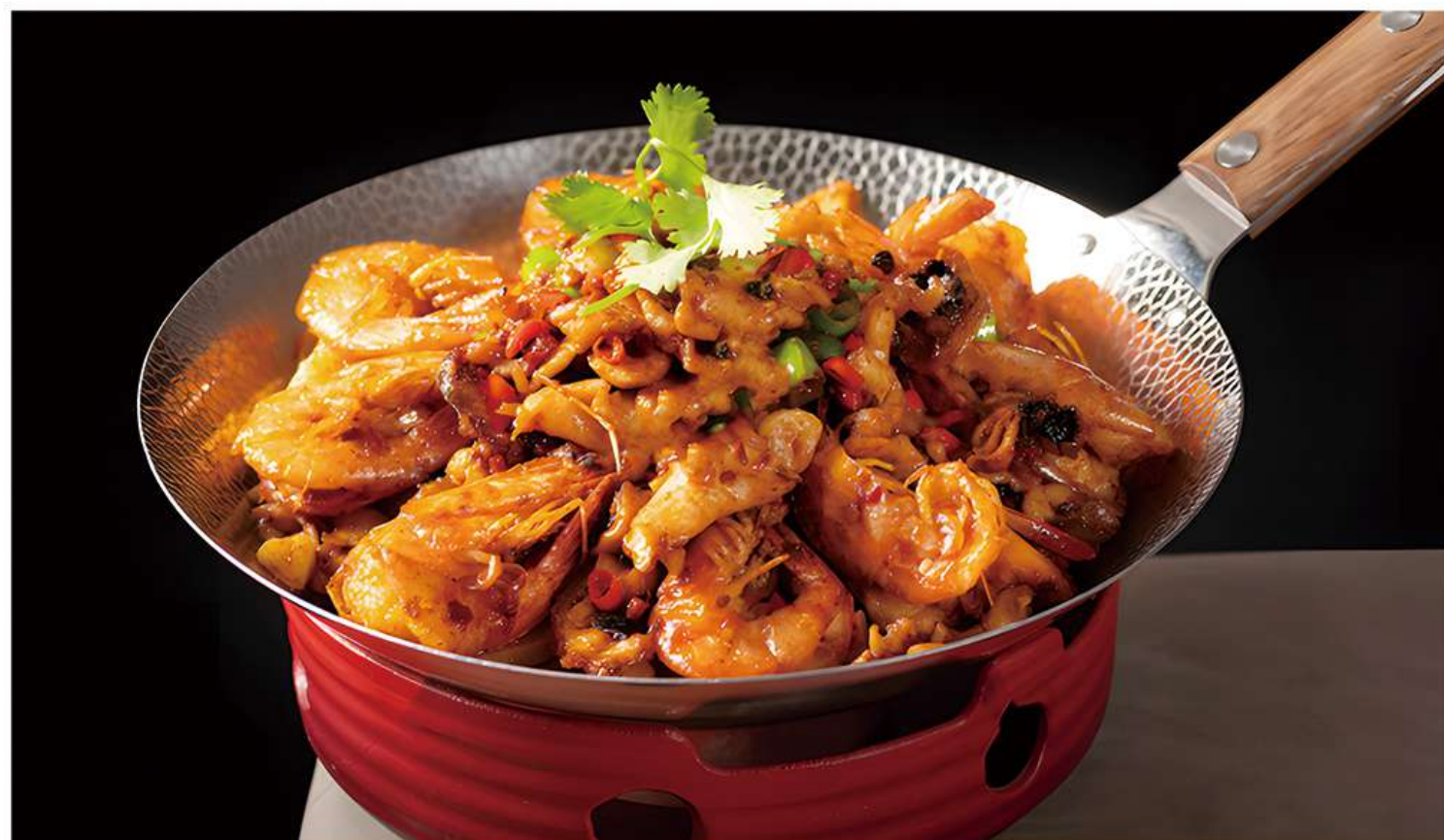
Calmars-Crevettes Sautés Pimentés 香辣鱿鱼虾 19€