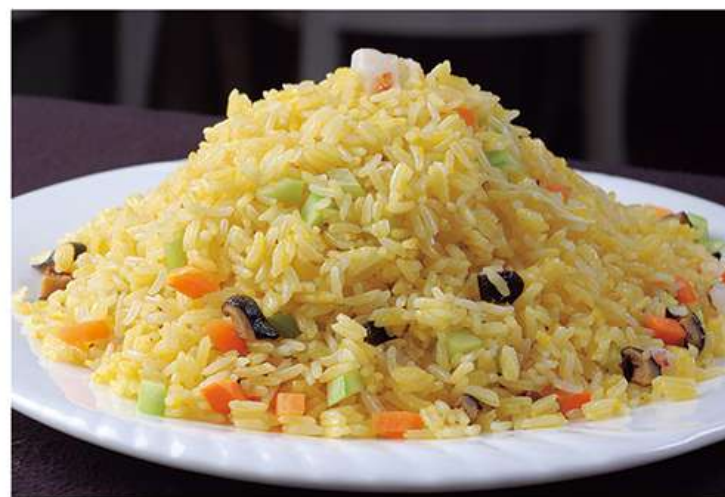
Riz Sauté 炒饭 8.5€