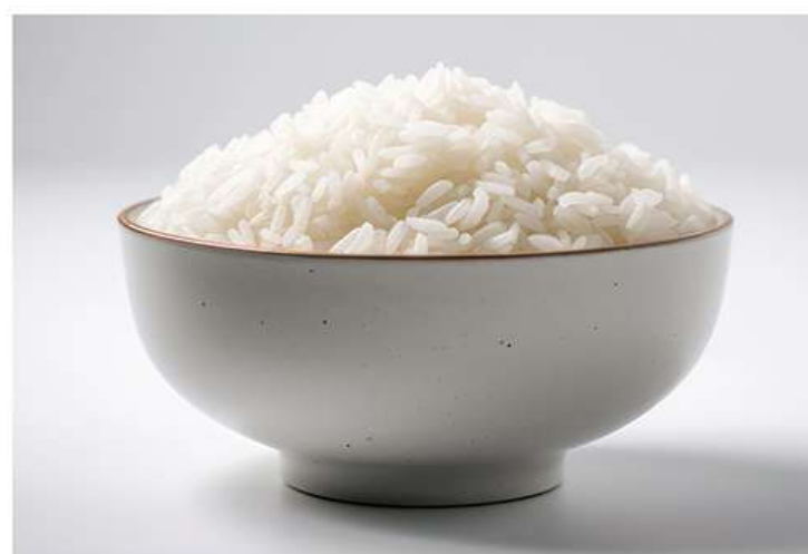
Riz Blanc 米饭 2€

图片仅供参考，请以实物为准 Les images sont fournies à titre indicatif seulement, veuillez vous référer au produit réel.