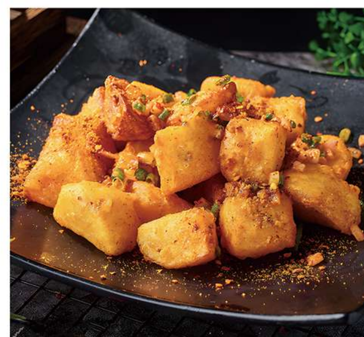
Pommes de Terre au sel épicé 椒盐土豆 13€