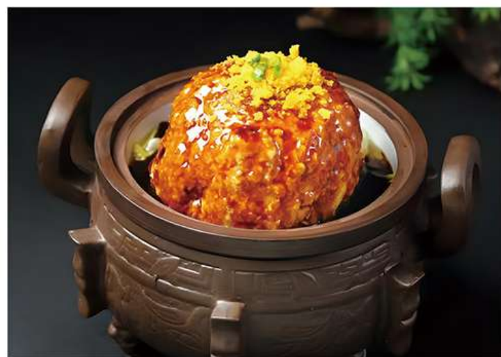
Shi Zi Tou