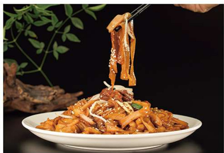
Nouilles de riz Sautées 干炒牛河 12.5€