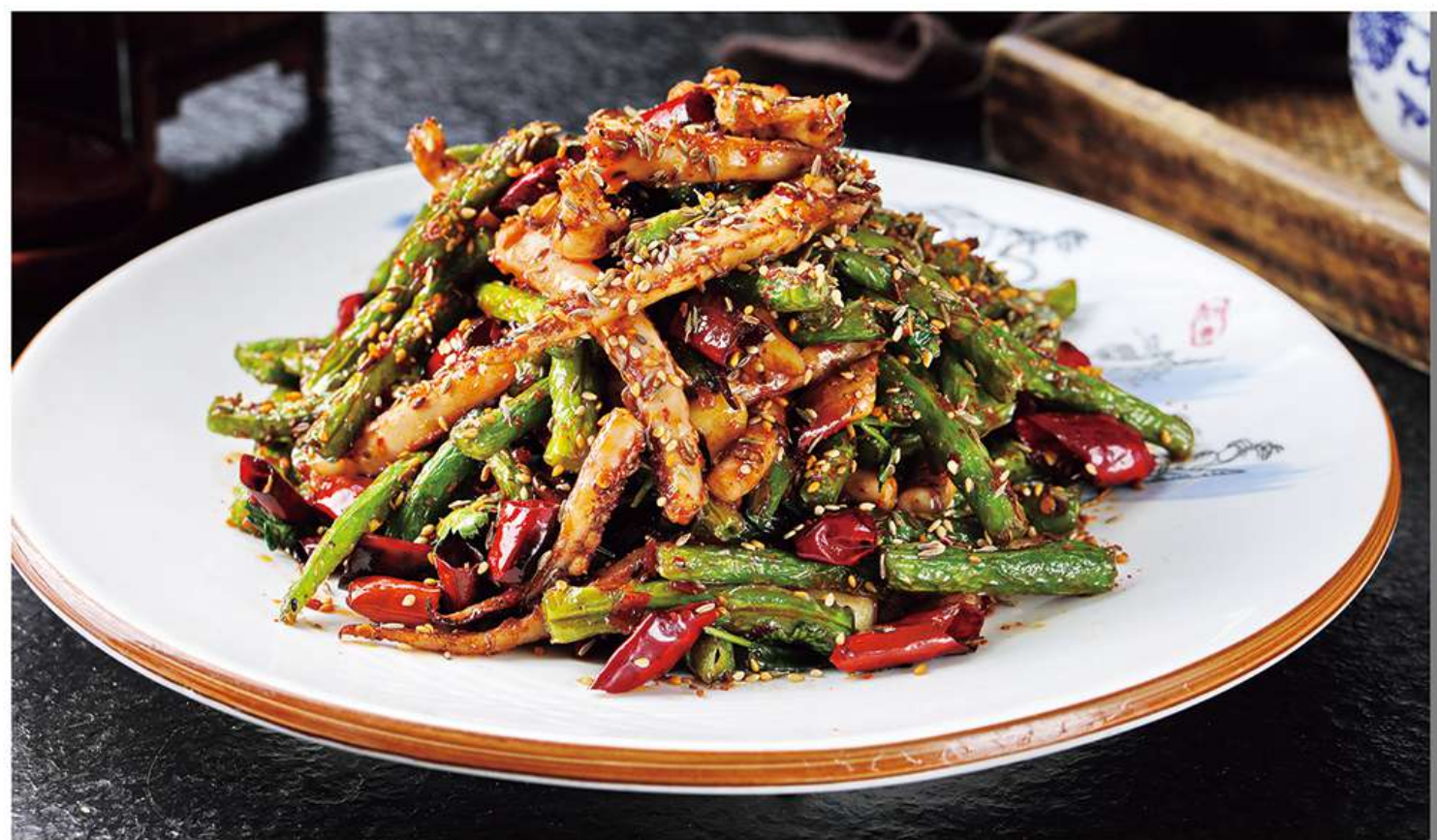
Calamars Grillés aux Haricots Verts 烧烤鱿鱼四季豆 15.8€

图片仅供参考，请以实物为准 Les images sont fournies à titre indicatif seulement, veuillez vous référer au produit réel.