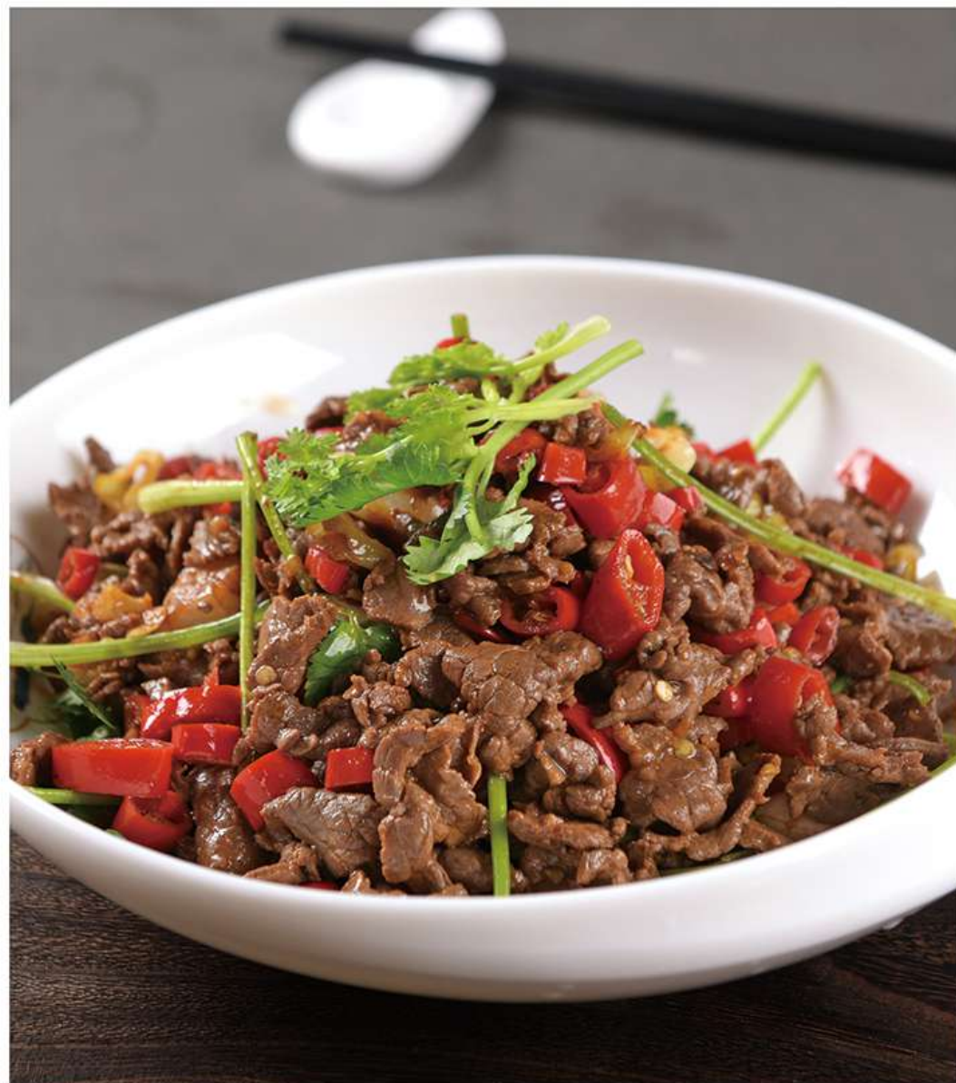
Boeuf Sauté 小炒牛肉 18€