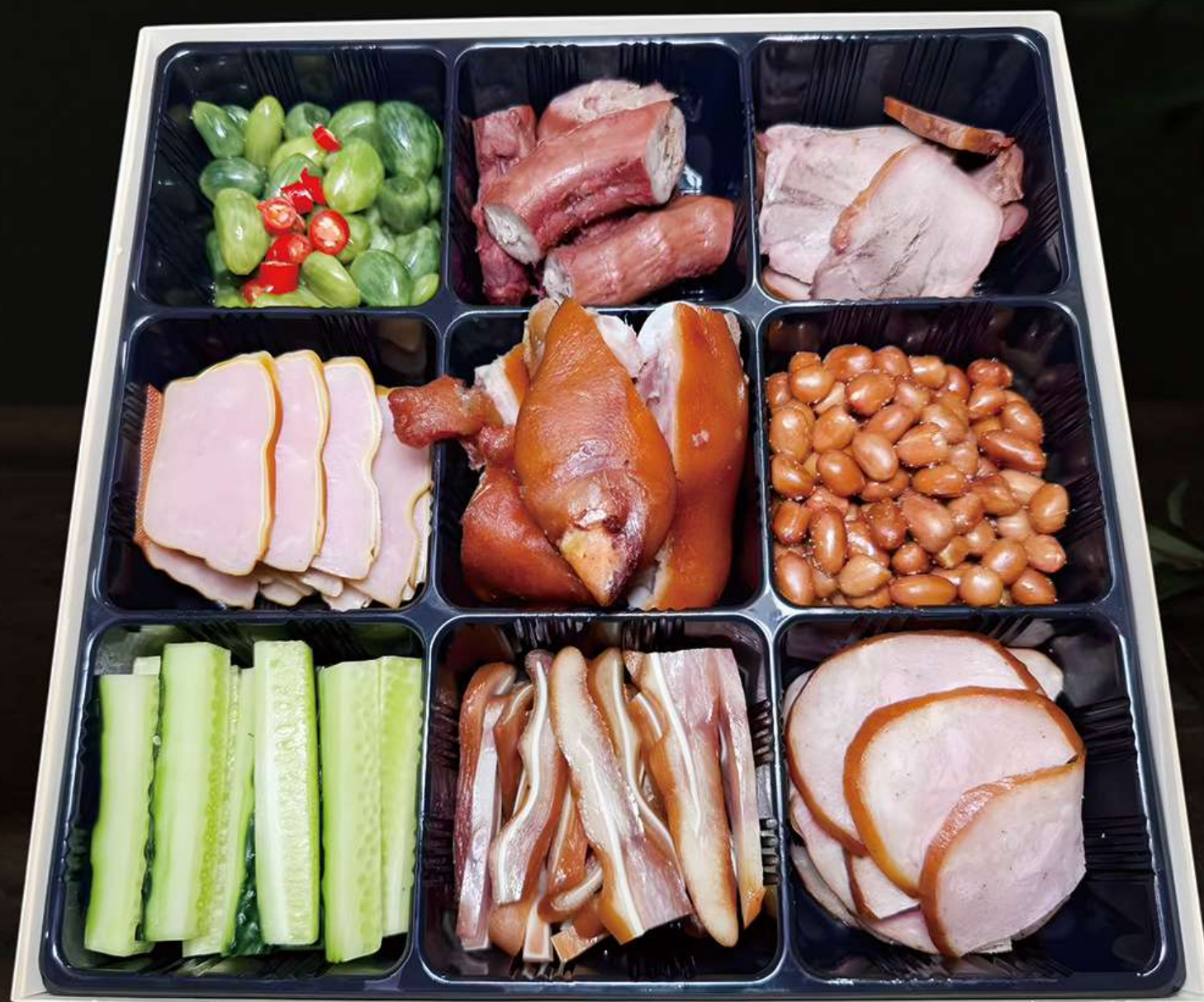
Plateau mariné(6 viandes, 3 légumes)