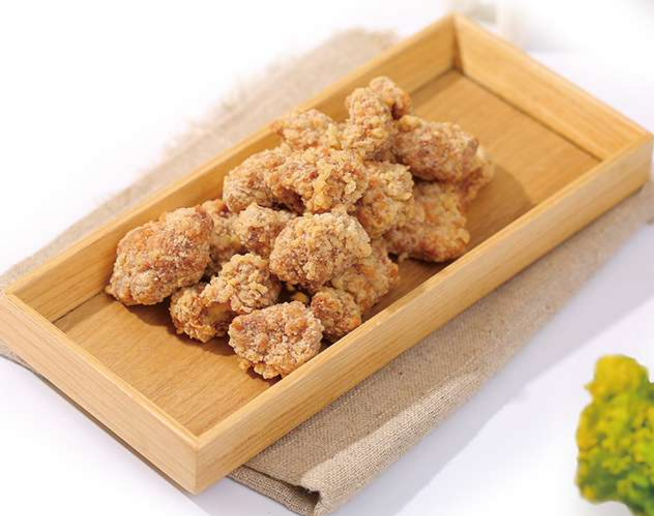
Poulet Croustillant Taiwanais 盐酥鸡 12€