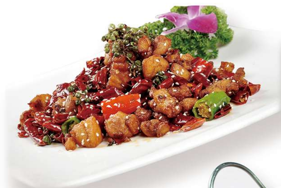
Poulet de Chongqing 辣子鸡 15.8€