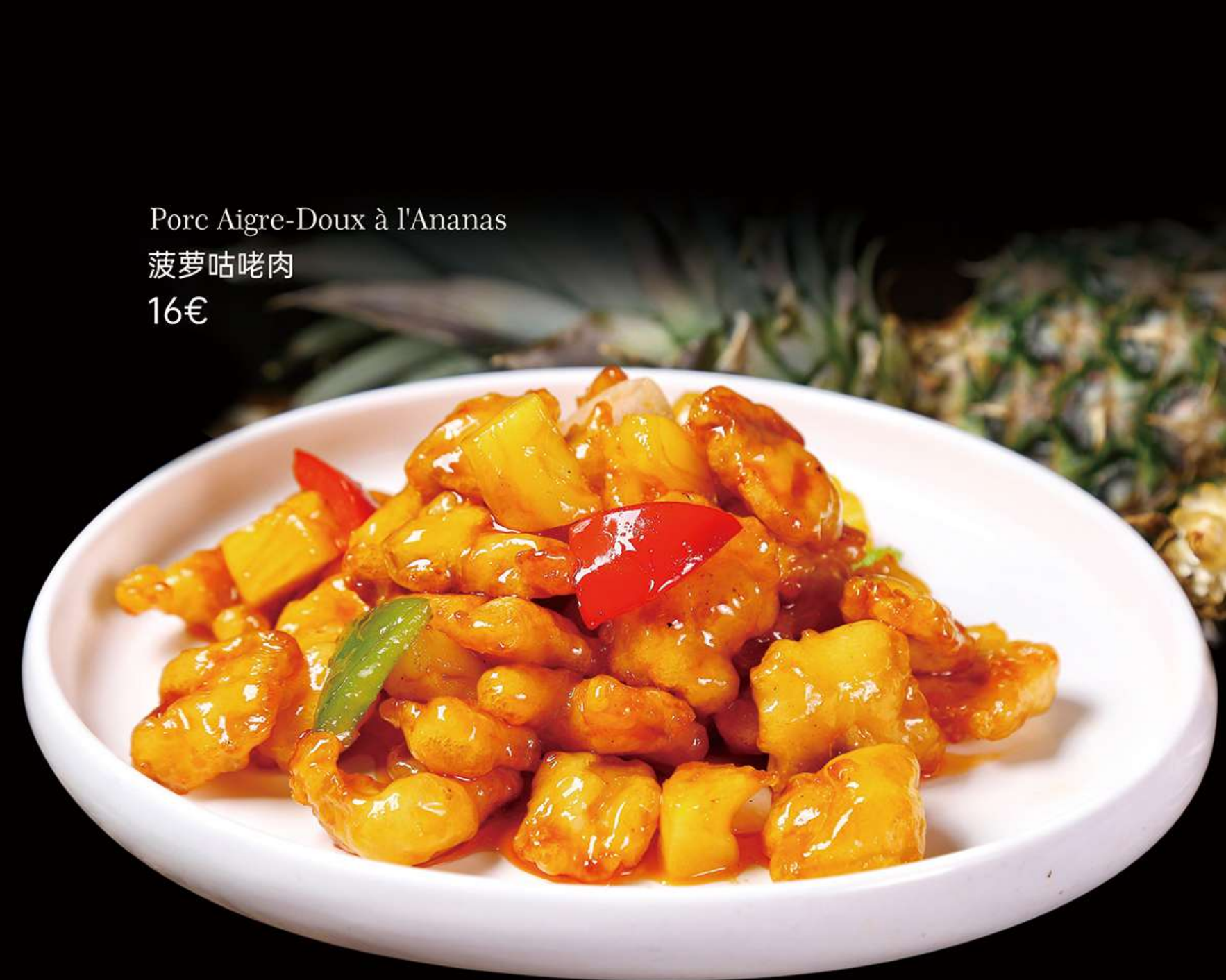
Porc Aigre-Doux à l'Ananas

图片仅供参考, 请以实物为准 Les images sont fournies à titre indicatif seulement, veuillez vous référer au produit réel.