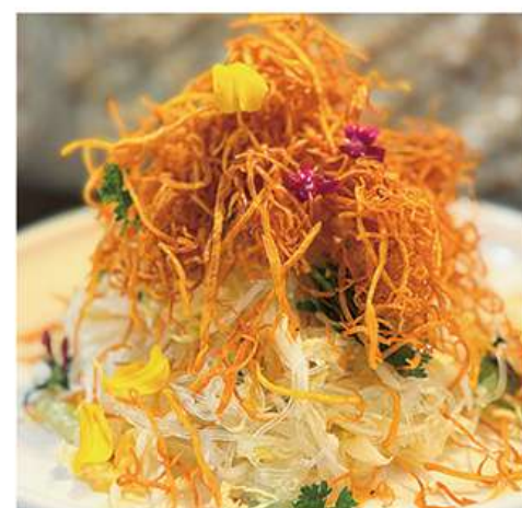
Salade de Trois Délices