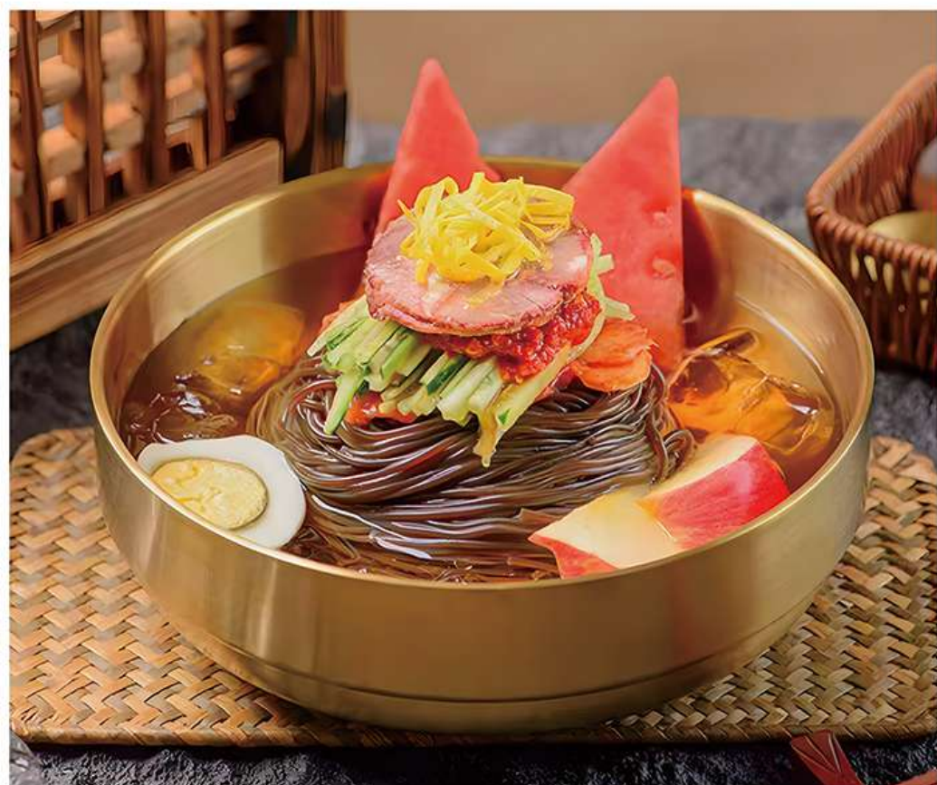
Nouilles Froides de Pyongyang 冷面 16.8€